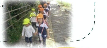
いっしょにいこう！

横断歩道の歩き方や、道路の歩き方などを学び、交通ルールを意識しながら散歩に出かけています。小さいお友達と一緒に出かけるときは、自分たちが時にはリードしたり、守ってあげる！という気持ちで出かける姿が見られました。