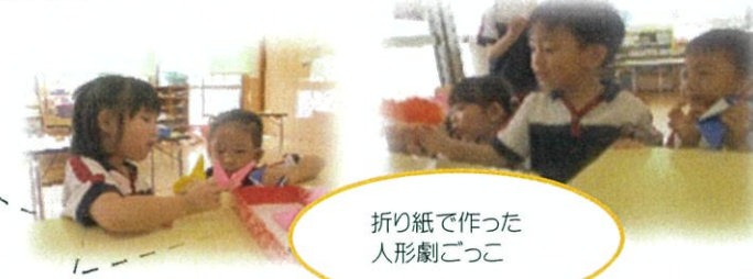
折り紙で作った人形劇ごっこ

友達と一緒に遊ぶ中で、それぞれに役割を決めたり、協力して一つの物を作り上げる事の楽しさを味わいました。またそれを使ってごっこ遊びも楽しみましたよ。