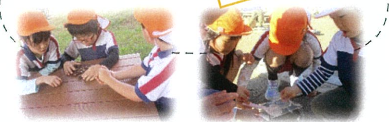
水に入れたら見えなくなったよ

所庭で氷や霜を発見!!その他にもつららなど、冬の自然を見つけて手に取りながら形や質感を感じたり、自然の不思議さを感じました。自分達でも氷作りをしたいと、いろいろな容器で凍らせることに成功しましたよ！