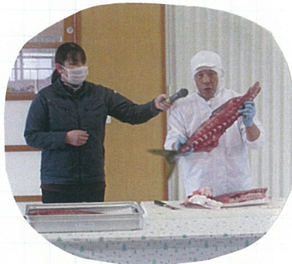
身と骨がきれいに 分けられました🍀