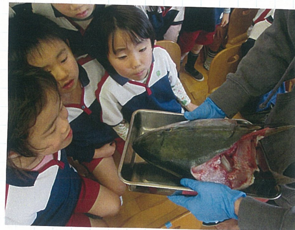
魚師の大きな豆頁に興味津々 😊